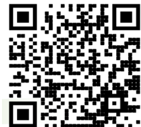
每日三讀三禱網頁

讀者可以透過每日三讀三禱網頁： www.1day3read3pray.com 或掃描以下 QR Code，每週接收每日三讀三禱靈修材料；亦可透過影音平台，聆聽每天經課與默想。歡迎與您的屬靈伙伴分享使用，在上主話語中一同成長。